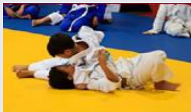
Copa Corpore Sano 2016 https://vimeo.com/185360682