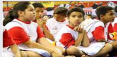
Lançamento do Educa Judô