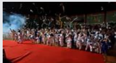
Troca de Faixas AJCS 2016 http://vimeo.com/201653893