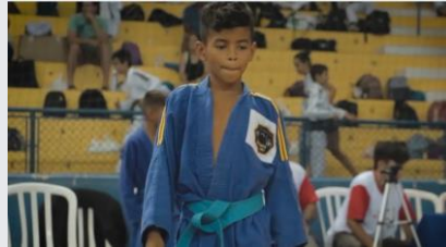
Copa Educa Judô – Fase II - Sertãozinho