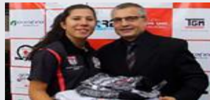
Copa Corpore Sano