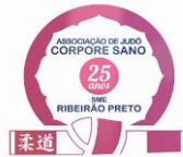
Corpore Sano 25 Anos