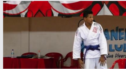
Copa Educa Judô – Fase II – Ribeirão Preto