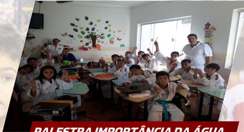
PALESTRA IMPORTÂNCIA DA ÁGUA