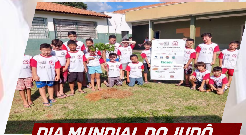
DIA MUNDIAL DO JUDÔ