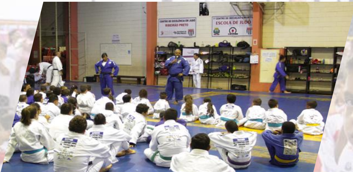
CARLOS HONORATO MEDALHA DE PRATA – JOGOS OLÍMPICOS SIDNEY 2000