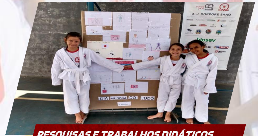
PESQUISAS E TRABALHOS DIDÁTICOS