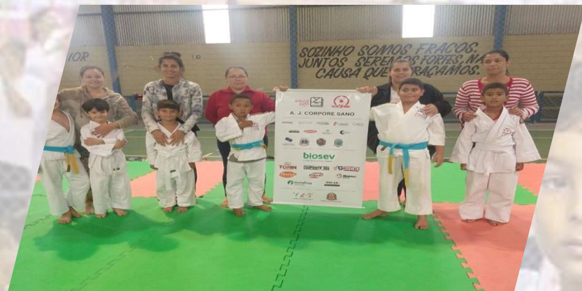
DIA DAS MÃES