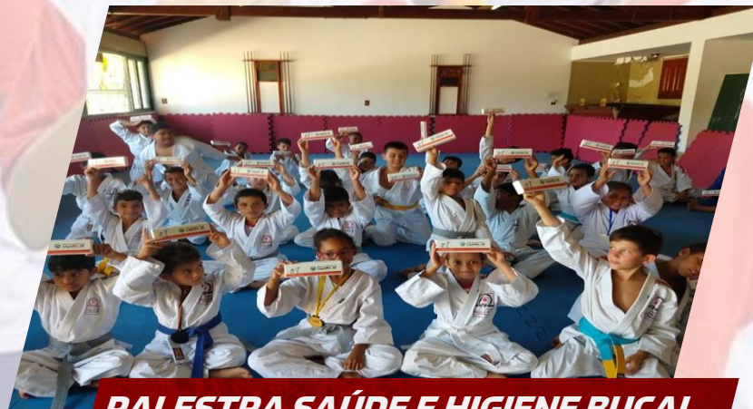
PALESTRA SAÚDE E HIGIENE BUCAL