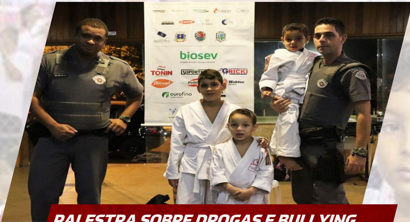
PALESTRA SOBRE DROGAS E BULLYING