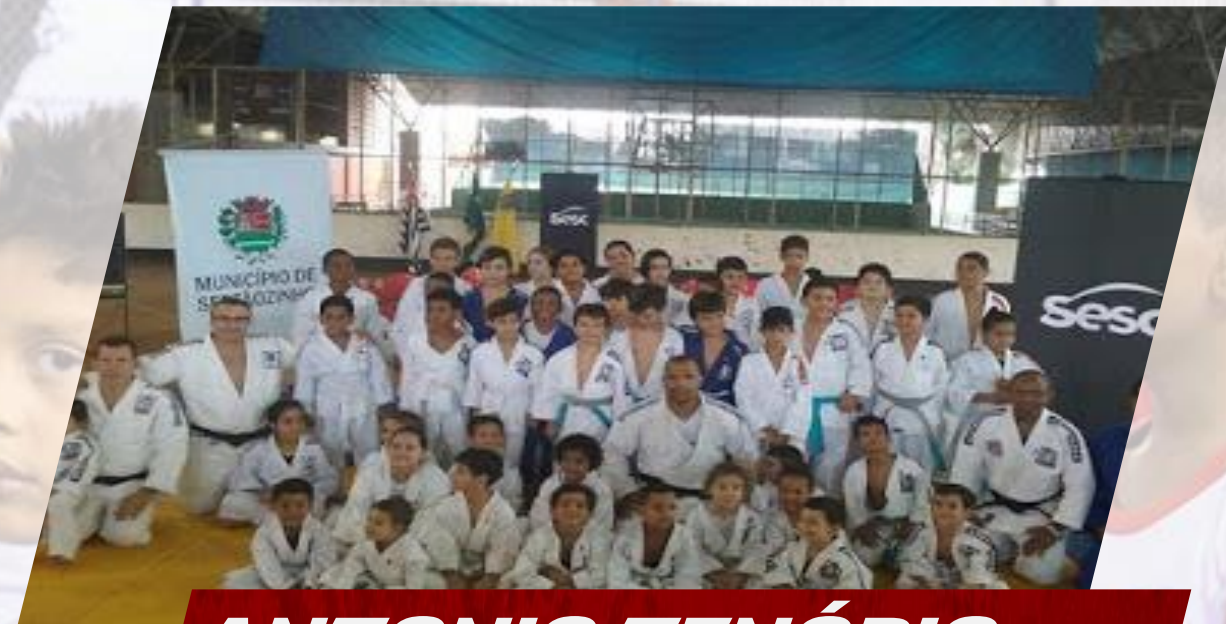
ANTONIO TENÓRIO TETRACAMPEÃO PARALÍMPICO – ATLANTA 1996, SIDNEY 2000, ATENAS 2004 E BEIJING 2008