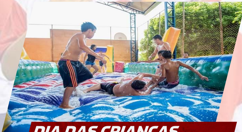
DIA DAS CRIANÇAS