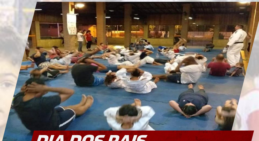
DIA DOS PAIS