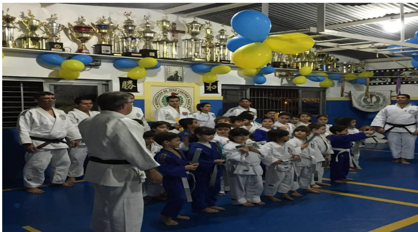
FOTO 01 – Troca de faixas na sede da Associação em 06/2014 FOTO 02 – Troca de faixas na sede da Associação em 12/2014