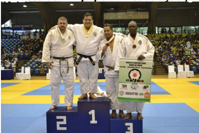
Foto 03 – Equipe da Associação / Foto 04 – Equipes que participaram

Foto 02 – Saída da viagem para o treinamento