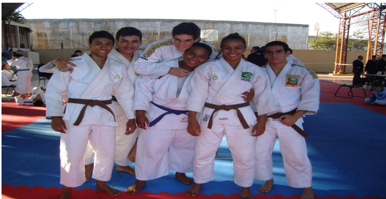
2011 – Jogos da Juventude na cidade de Osvaldo Cruz