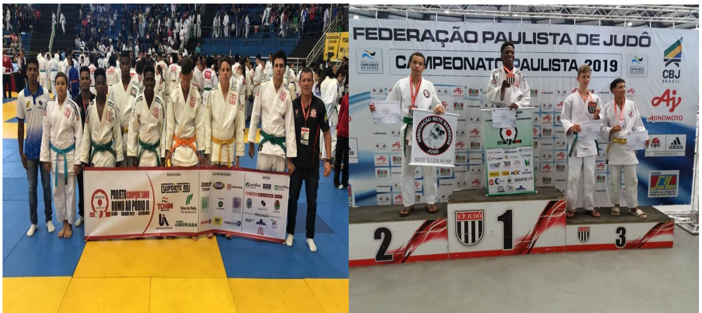
LEGENDA 2019: FOTO 01 – Equipe que participou do campeonato Paulista Fase final na cidade de Itaipicirica da Serra