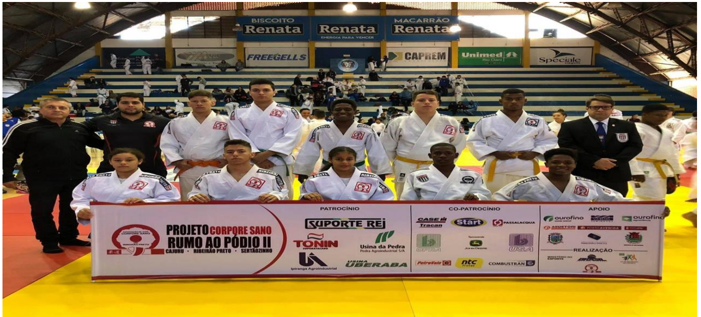
LEGENDA 2019: FOTO 01 – Equipe que participou do campeonato Inter estadual na cidade de Rio Claro