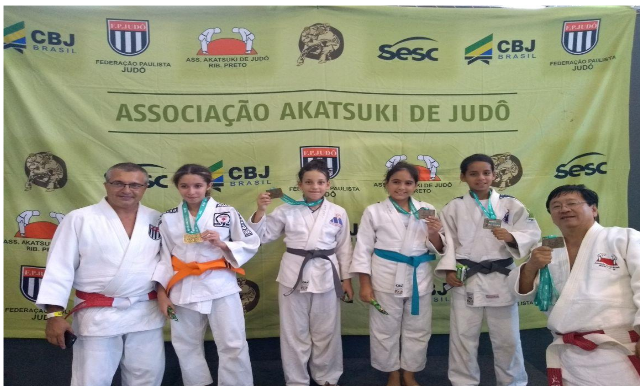
LEGENDA 2018: FOTO 01 – Associação participando com seus pequenos no festival SESC de Ribeirão Preto.

Rua: Pinheiro Machado, 1006 – Piso Superior - Sala 02 Rib. Preto – Campos Elíseos – S.P. - Brasil – CEP 14.080-550 CNPJ: 17.260.115/0001-18 - Inscrição Estadual: Isento Telefone - ( 016 ) 30232055 – Celular - 99993-3933 E-mail: cleberjudorp@hotmail.com Entidade oficial, fundada em 01 de junho de 1995 Filiada a Fed. Paulista de Judô e Conf. Brasileira de Judô Utilidade Pública Municipal LEI Nº 13.803 Utilidade Pública Estadual LEI Nº 16.440 www.judocorporesano.com.br