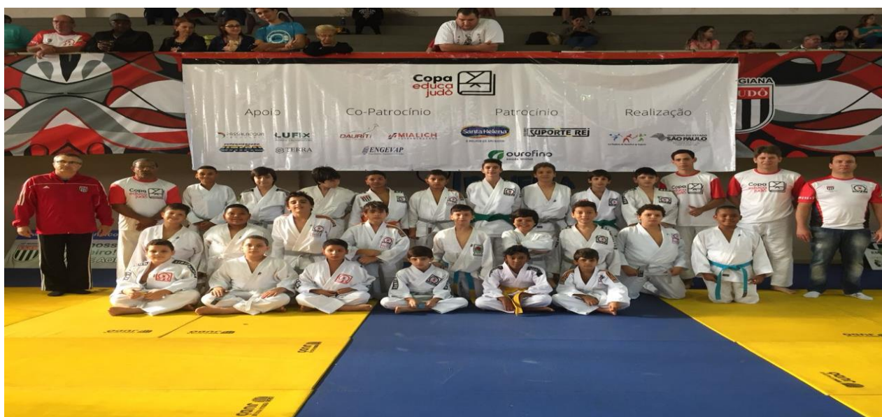
LEGENDA 2018: FOTO 01 – Associação participando com sua equipe na Copa Educa Judo em Ribeirão Preto.