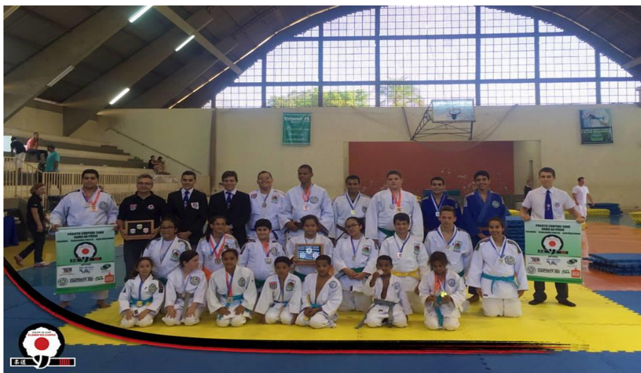
LEGENDA 2016: Parte da equipe da Associação em campeonato paulista ginásio Baby Barione na cidade de Monte Alto - Maio de 2016