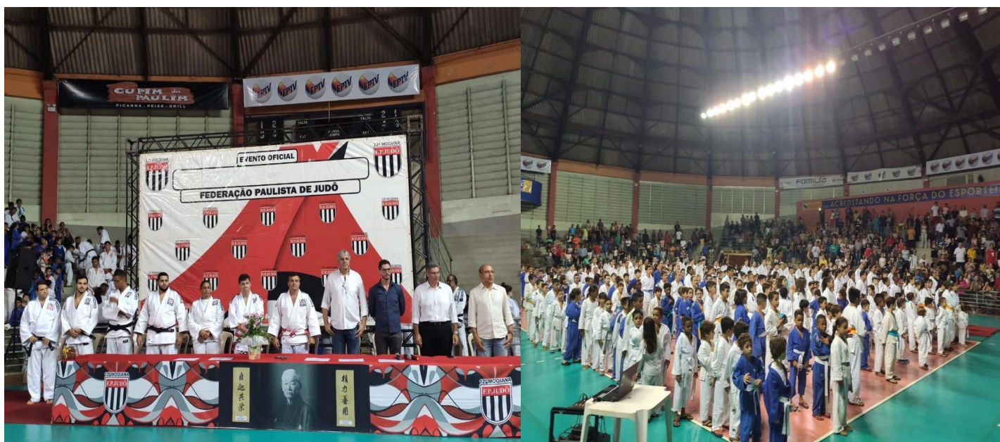
LEGENDA 2019: FOTO 01 – 12/2019 – Cerimonial de graduação de mais de 500 judocas no ginásio central da cava do bosque em Ribeirão Preto.

Rua: Pinheiro Machado, 1006 – Piso Superior - Sala 02 Rib. Preto – Campos Elíseos – S.P. - Brasil – CEP 14.080-550 CNPJ: 17.260.115/0001-18 - Inscrição Estadual: Isento Telefone - ( 016 ) 30232055 – Celular - 99993-3933 E-mail: cleberjudorp@hotmail.com Entidade oficial, fundada em 01 de junho de 1995 Filiada a Fed. Paulista de Judô e Conf. Brasileira de Judô Utilidade Pública Municipal LEI Nº 13.803 Utilidade Pública Estadual LEI Nº 16.440 www.judocorporesano.com.br