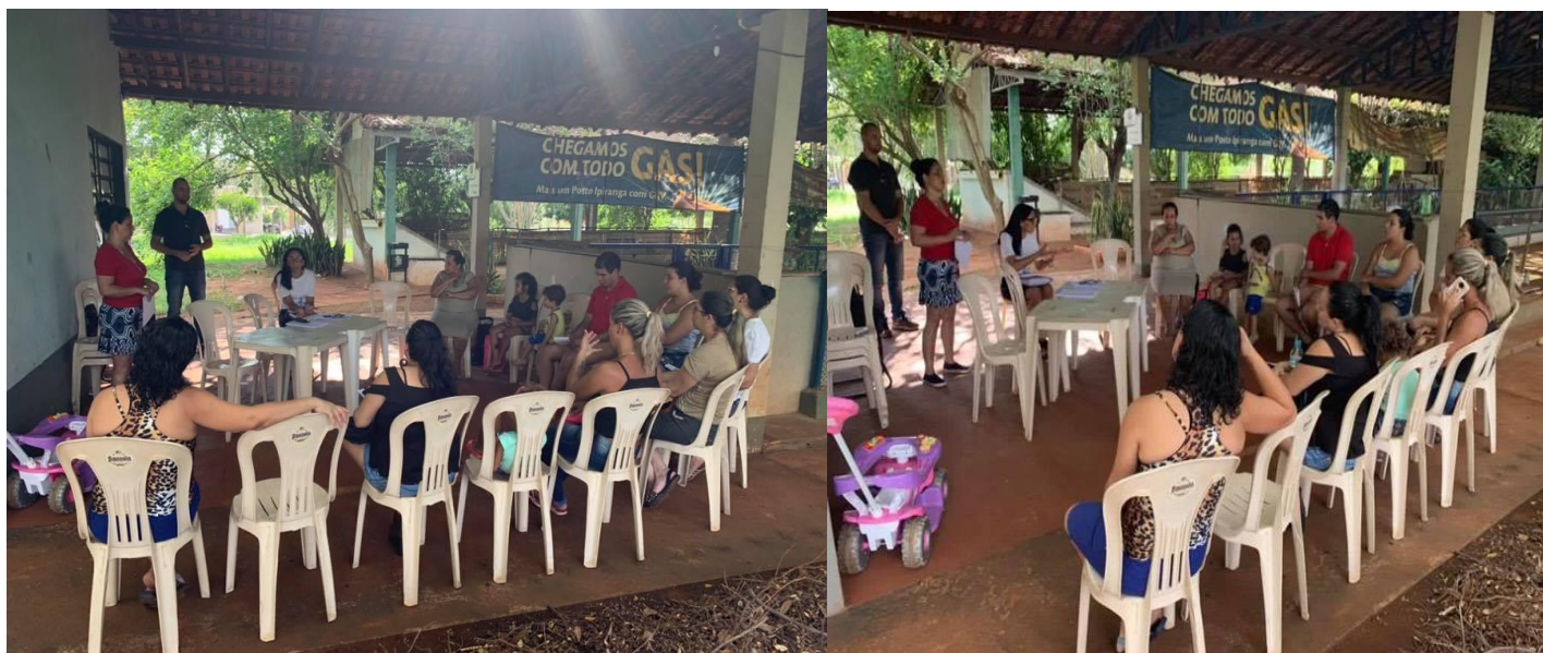
LEGENDA 2019: FOTO 01 – Reunião com as famílias dos alunos pertencentes ao núcleo Manoel Câmara em Ribeirão Preto, priorizando o fortalecimento de vínculo.

Rua: Pinheiro Machado, 1006 – Piso Superior - Sala 02 Rib. Preto – Campos Elíseos – S.P. - Brasil – CEP 14.080-550 CNPJ: 17.260.115/0001-18 - Inscrição Estadual: Isento Telefone - ( 016 ) 30232055 – Celular - 99993-3933 E-mail: cleberjudorp@hotmail.com Entidade oficial, fundada em 01 de junho de 1995 Filiada a Fed. Paulista de Judô e Conf. Brasileira de Judô Utilidade Pública Municipal LEI Nº 13.803 Utilidade Pública Estadual LEI Nº 16.440 www.judocorporesano.com.br