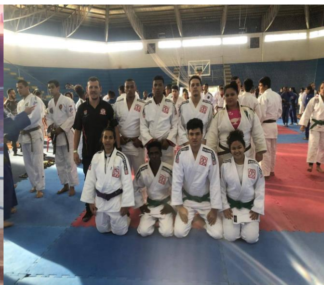
LEGENDA 2019: FOTO 01 – Delegação que representou Ribeirão Preto nos Jogos Abertos da Juventude na cidade de Marília FOTO 02 – Já em Marília a equipe preparada.