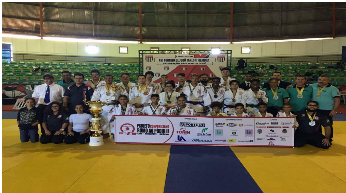
LEGENDA 2019: FOTO 01 – Associação participando com sua equipe no torneio Takeshi Uemura, evento tradicional da colônia japonesa na cidade de Guaira.

Rua: Pinheiro Machado, 1006 – Piso Superior - Sala 02 Rib. Preto – Campos Elíseos – S.P. - Brasil – CEP 14.080-550 CNPJ: 17.260.115/0001-18 - Inscrição Estadual: Isento Telefone - ( 016 ) 30232055 – Celular - 99993-3933 E-mail: cleberjudorp@hotmail.com Entidade oficial, fundada em 01 de junho de 1995 Filiada a Fed. Paulista de Judô e Conf. Brasileira de Judô Utilidade Pública Municipal LEI Nº 13.803 Utilidade Pública Estadual LEI Nº 16.440 www.judocorporesano.com.br