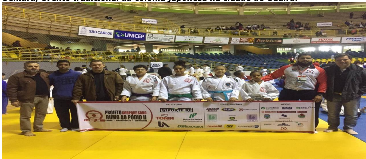
LEGENDA 2019: FOTO 01 – Final Do campeonato paulista aspirantes sub 15 na cidade de São Carlos