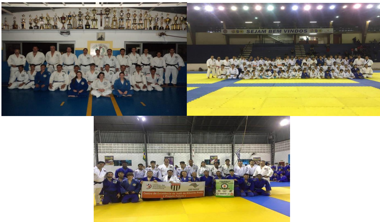
FOTO 01: Treinamento na sede da Associação 11/2015 FOTO 02: Treinamento com Campeão Olímpico Rogerio Sampaio 12/2015 FOTO 03: Treinamento Ibirapuera 11/2015