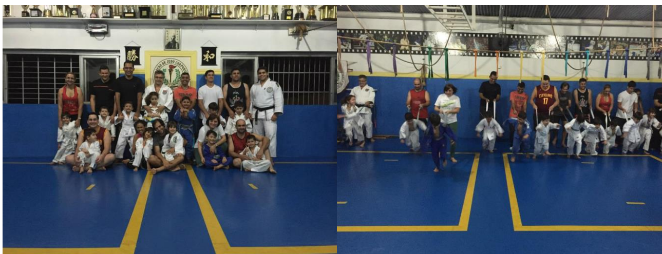
FOTO 01 E 02: Na sede da Associação em comemoração do dia dos pais 2015

Rua: Pinheiro Machado, 1006 – Piso Superior - Sala 02 Rib. Preto – Campos Elíseos – S.P. - Brasil – CEP 14.080-550 CNPJ: 17.260.115/0001-18 - Inscrição Estadual: Isento Telefone - ( 016 ) 30232055 – Celular - 99993-3933 E-mail: cleberjudorp@hotmail.com Entidade oficial, fundada em 01 de junho de 1995 Filiada a Fed. Paulista de Judô e Conf. Brasileira de Judô Utilidade Pública Municipal LEI Nº 13.803 Utilidade Pública Estadual LEI Nº 16.440 www.judocorporesano.com.br