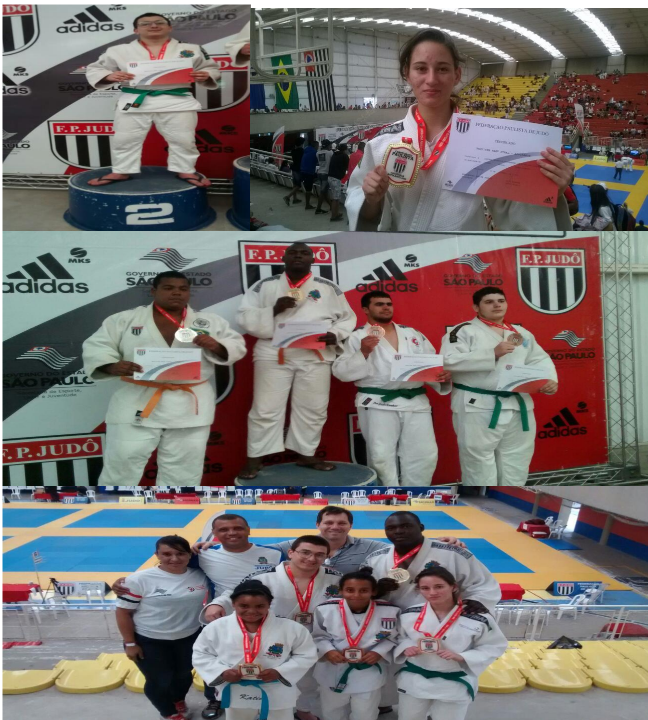
LEGENDA 2015: Paulista em Mauá e Benemérito de judô – 17-18/10/2015 Fotos 01, 02 e 03 – Campeões Paulista 2015 – Foto 04 – Equipe completa